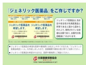
(ジェネリック医薬品希望シールイメージ)